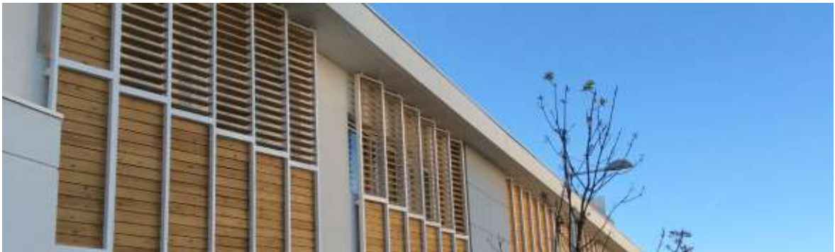
Figura 10. Opció gelosia amb lamel·les orientables d'alumini – segon exemple d'aplicació