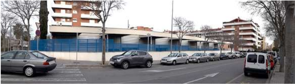
Figura 2. Vista panoràmica exterior dels patis de les aules dels infants