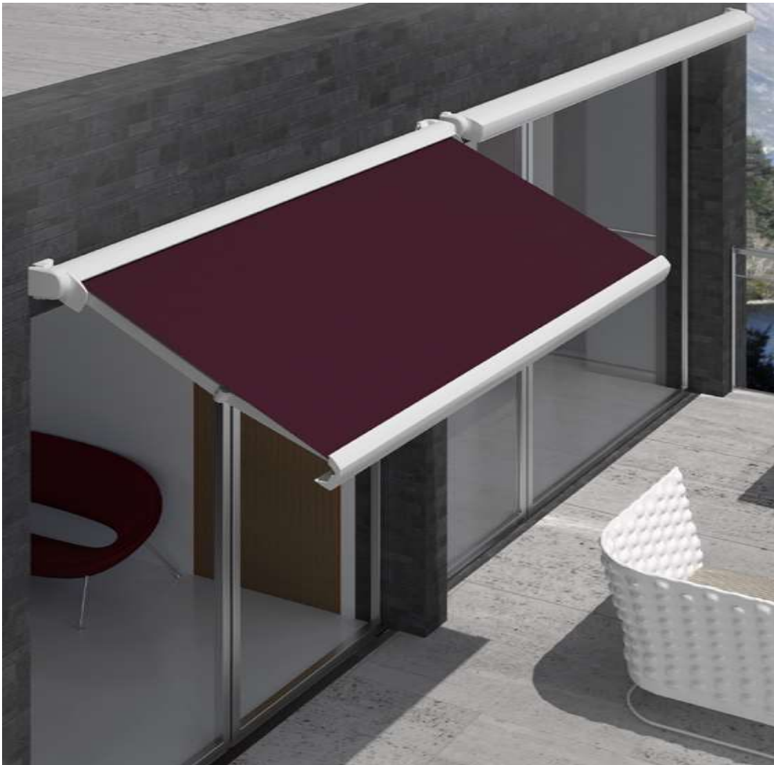
Figura 8. Opció tendals d'ombra - model Tendal cofre