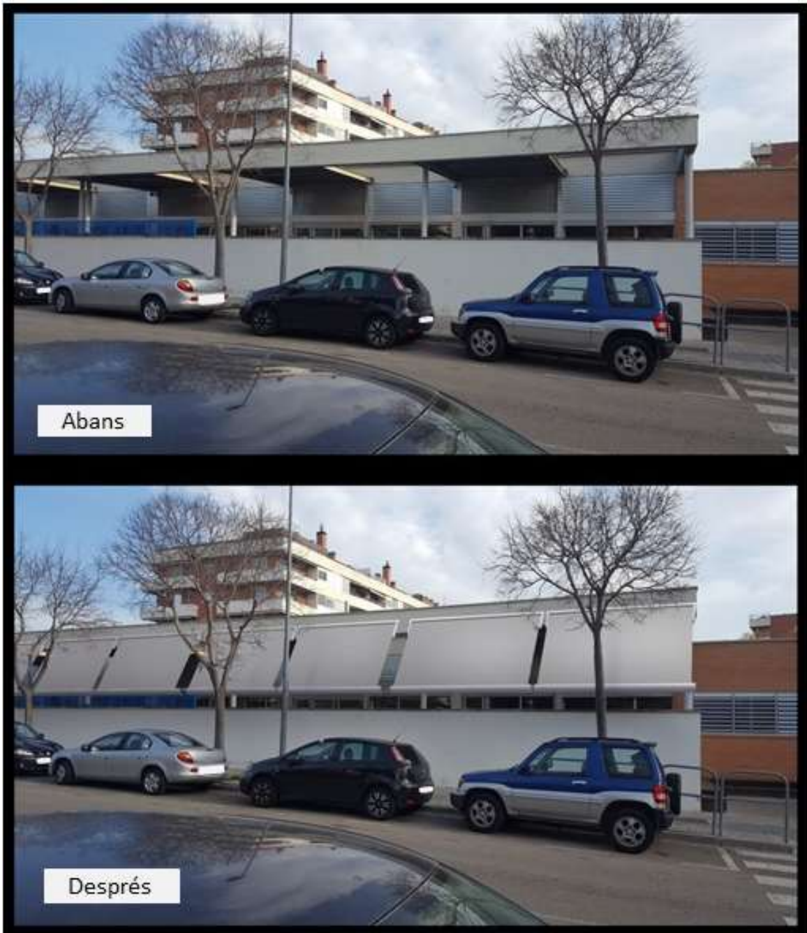
Figura 7. Opció tendals d'ombra - simulació de l'aplicació