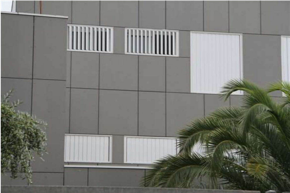
Figura 9. Opció gelosia amb lamel·les orientables d'alumini – primer exemple d'aplicació