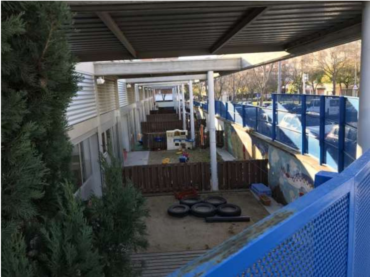
Figura 4. Vista interior dels patís de les aules dels infants