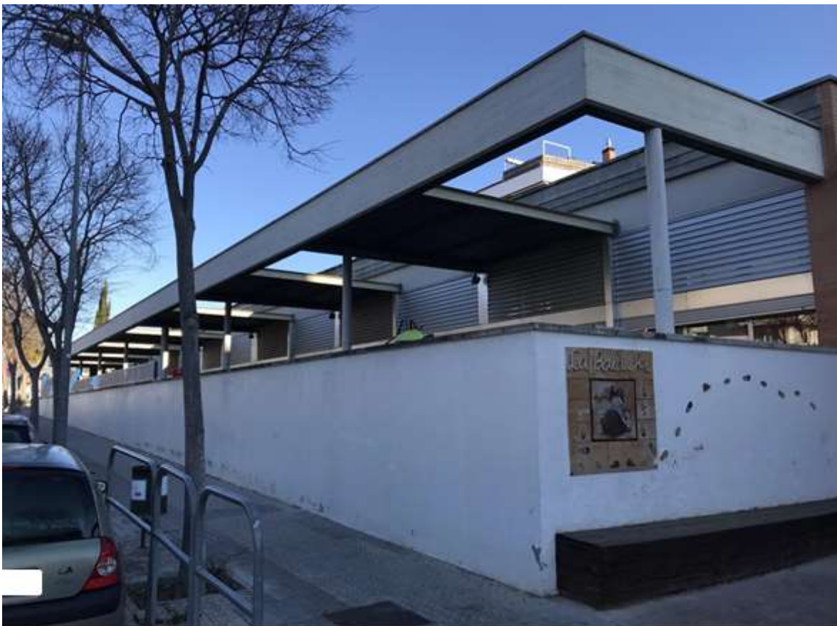
Figura 3. Vista exterior dels patis de les aules dels infants