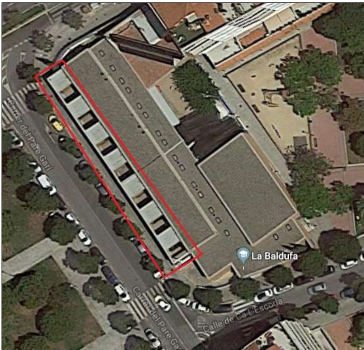
Figura 1. Vista aèria de La Baldufa