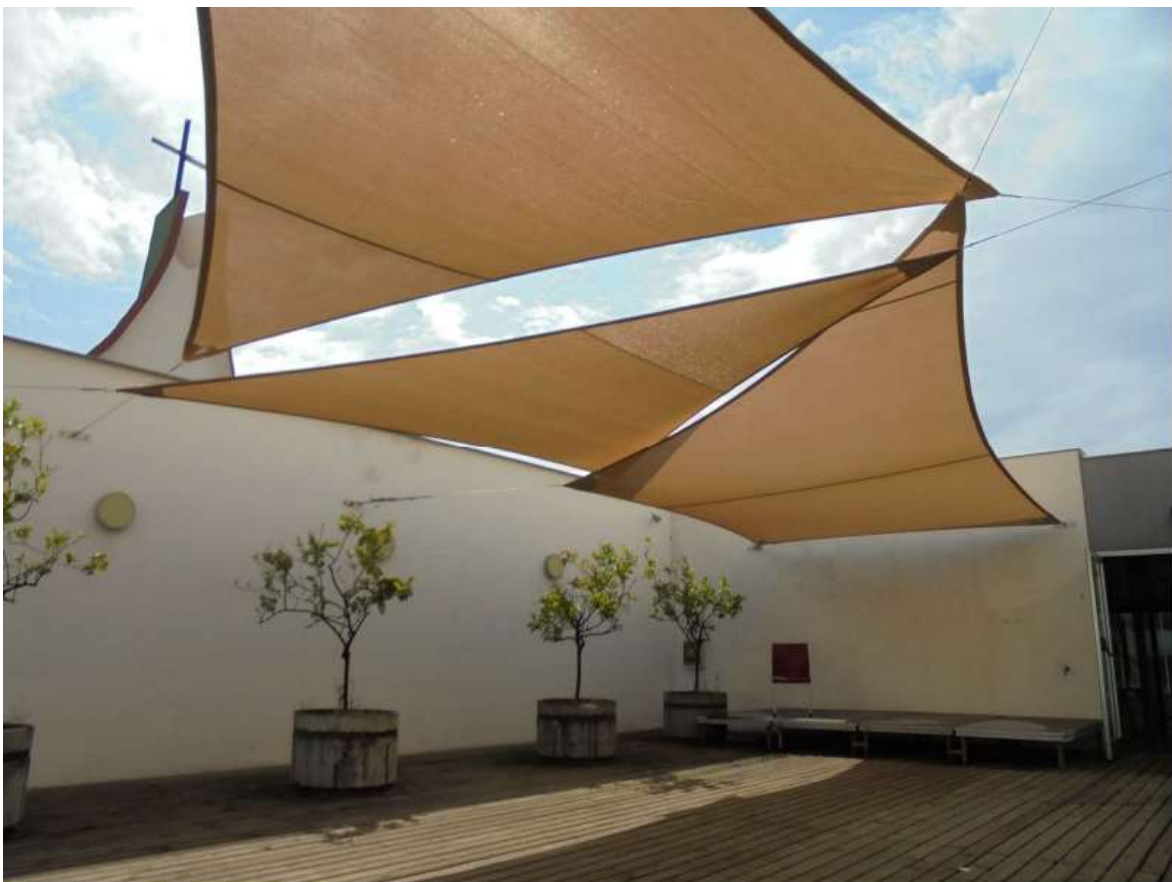
Figura 6. Opció veles d'ombra - exemples de veles de petit tamany al pati del Llimoners a la Biblioteca Cardona Torrandell de Vilanova i la Geltrú

Notes: Opció 1: Anclatge a màstils amb possibilitat d'anclatge a 2 alçades; Opció 2: Anclatge a parament de tancament de la terrassa.